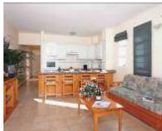
(Unterkunft App. Jardin del Conde)