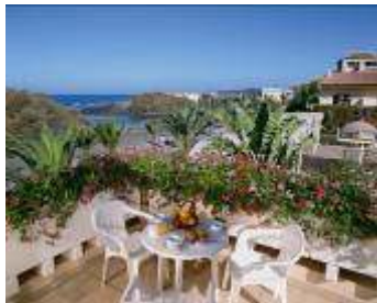
(Unterkunft App. Jardin del Conde)

Die schöne Appartementanlage mit Pool liegt direkt am Meer und nur wenige Meter vom Strand entfernt im Ortsteil La Puntilla Valle Gran Rey. Zu Fuß ist es nicht weit bis ins Hafenviertel von Vueltas oder bis zur Promenade von La Playa mit seinen zahlreichen Bars. Die großzügig geschnittenen Appartements haben alle Bad, Schlafzimmer, Küche mit Wohnraum und Balkon oder Terrasse.