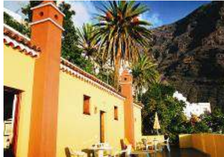
(Unterkunft Jardin Concha)