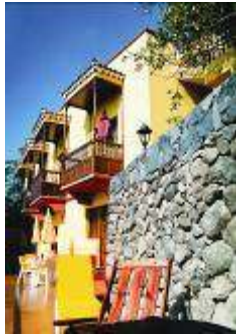
(Unterkunft Jardin Concha)

schöne Gemeinschaftsterrassen mit Tischen, Stühlen und Sonnenliegen stehen Ihnen zum Relaxen zur Verfügung. Das landestypische Frühstück wird mit Blick auf den blauen Atlantik serviert und zu Fuß sind es nur 10 Minuten bis zum Strand. Ebenso liegt die Gebirgswelt La Gomeras in unmittelbarer Nähe.